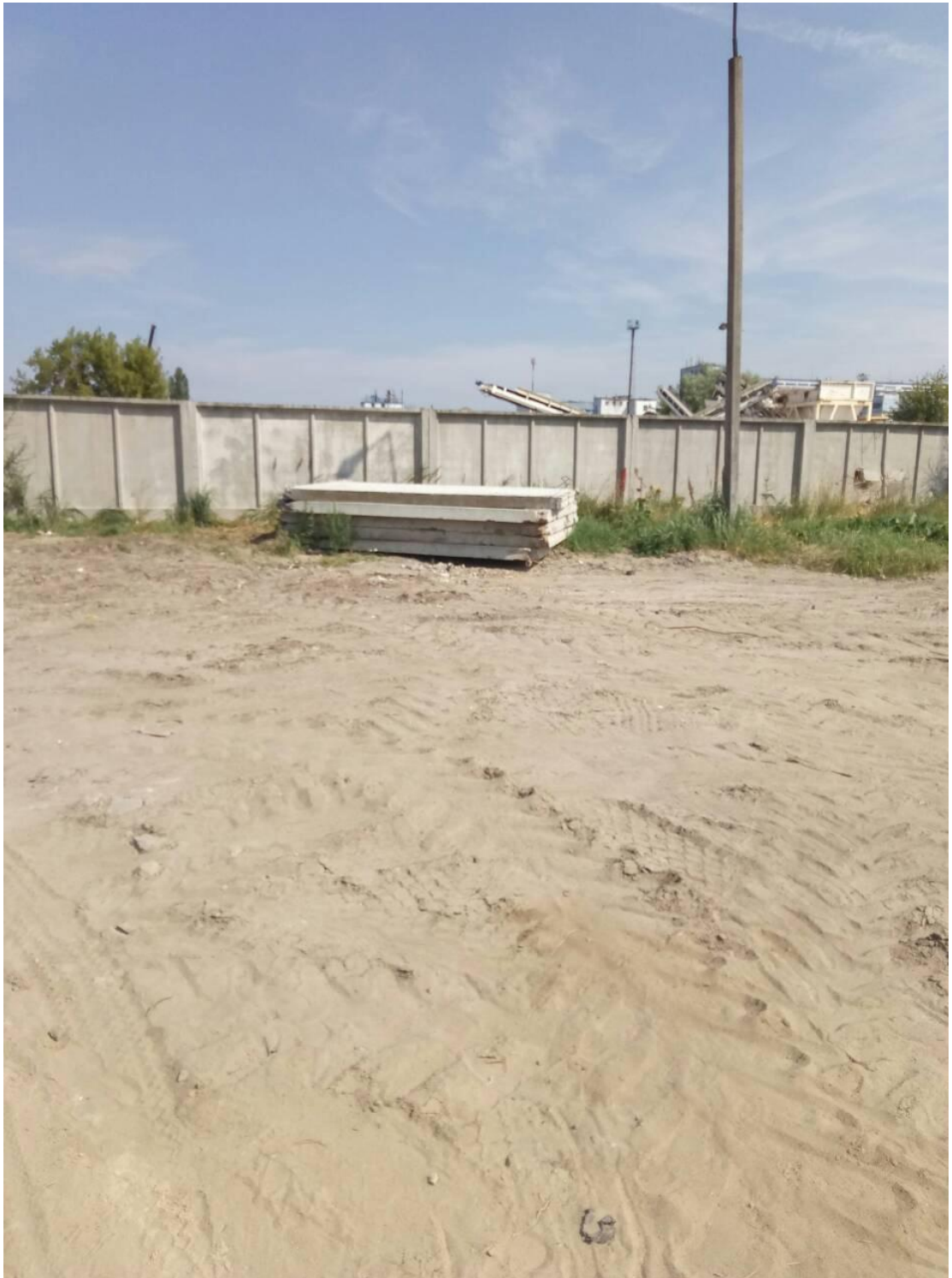
Ж/б плиты уложены без подкладок и прокладок