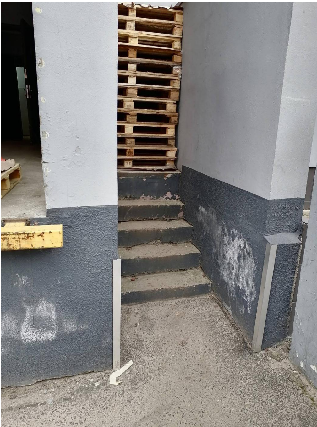
Проход на погрузо-разгрузочную рампу заставлен поддонами

трапы, сходни, мостки и тому подобное содержались в состоянии, исключающем возможность скольжения работающих и других лиц, были очищены от снега, льда, посыпаны песком, шлаком или другими противоскользящими материалами.