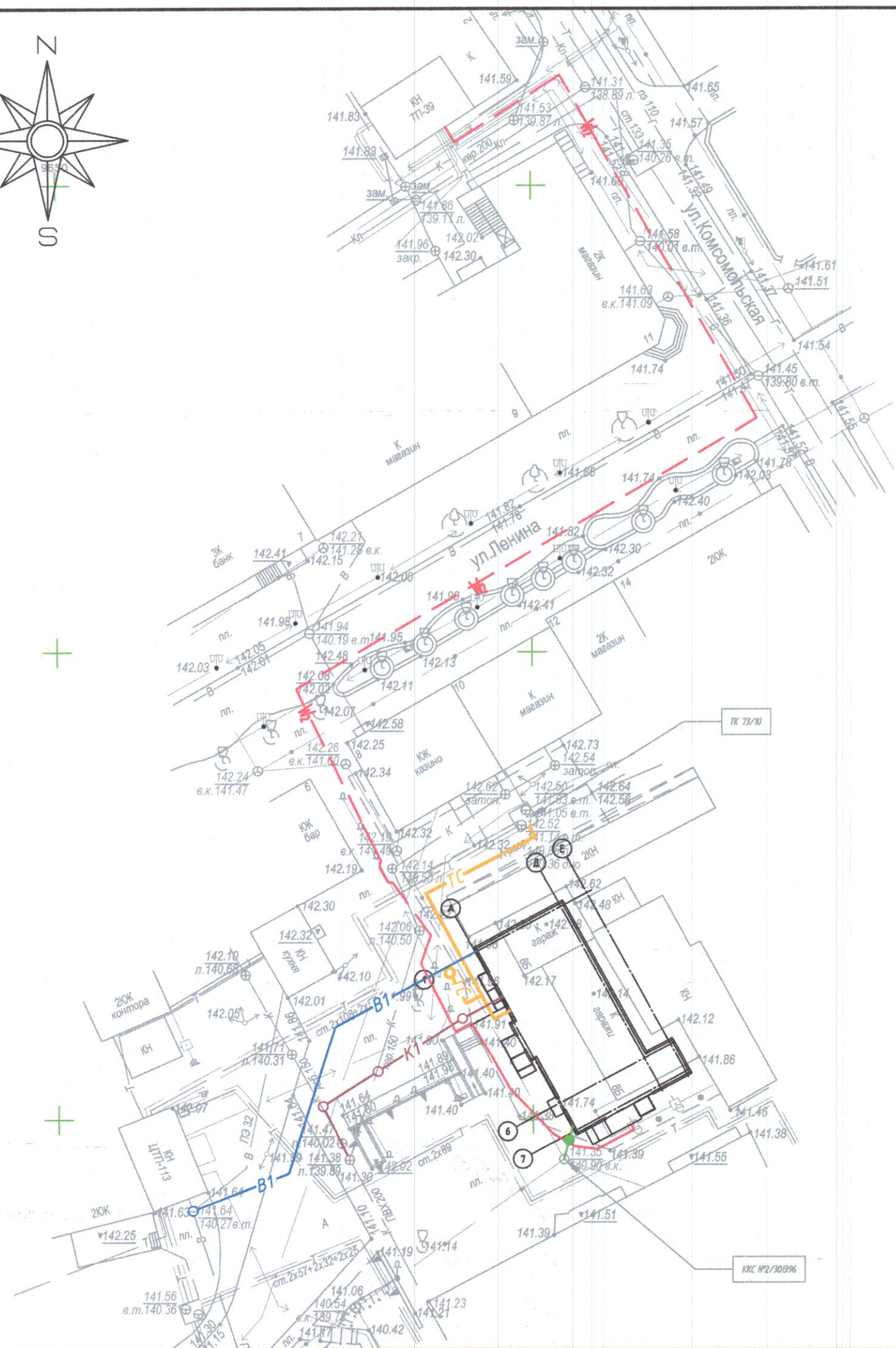
Условные обозначения сетей